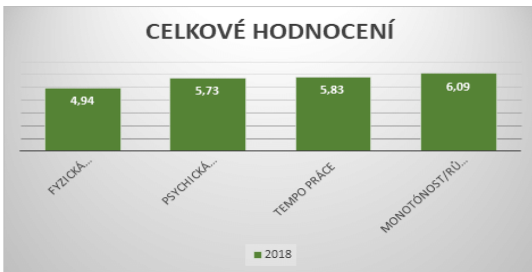
Graf č. 3: Průměrné hodnoty vybraných rizikových faktorů práce

Rozdíly ve výskytu rizikových faktorů jsou dány především jednotlivými profesemi.