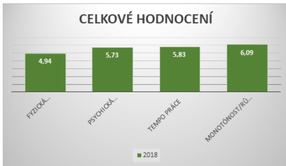
Graf č. 1: Průměrné hodnoty vybraných dimenzí charakteru práce

Respondenti využili ve všech měřených aspektech celou škálu odpovědí jedenáctibodové škály. Velký počet respondentů hodnotilo pracovní tempo uprostřed škály nabízených možností odpovědí. Fyzický a psychický aspekt práce ohodnotilo největší procento respondentů jako středně těžkou zátěž. Téměř osmnáct procent respondentů uvedlo, že jejich práce je velmi pestrá.