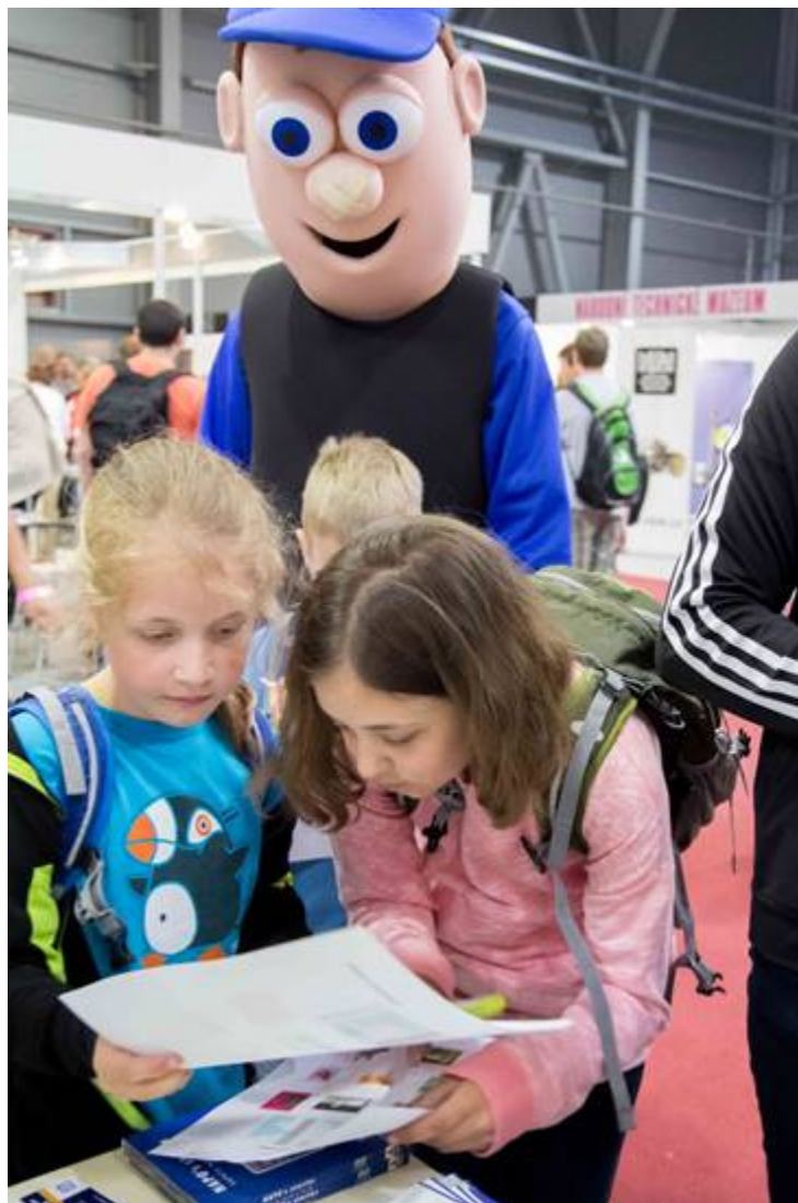
Obr. 3: Tlačeníce těch nejmladších u stolku s křížovkami a kvízy