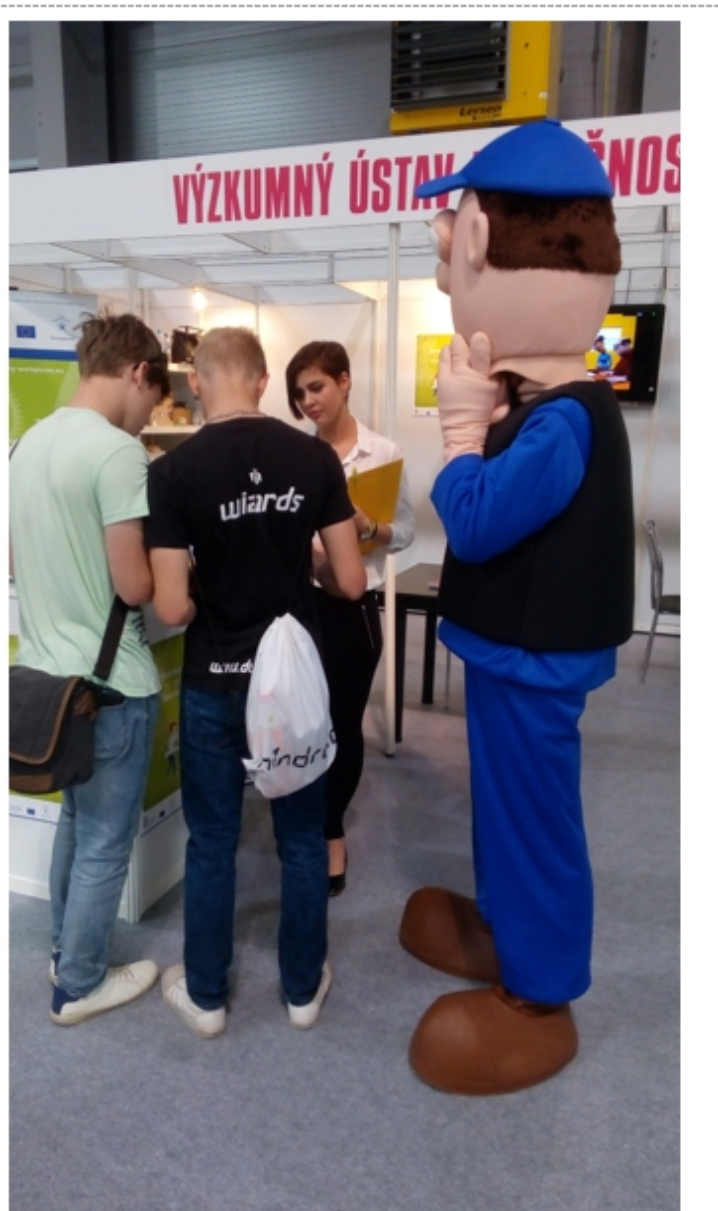
Obr. 2: Zájem a zaujetí návštěvníků stánku VÚBP, v.v.i.