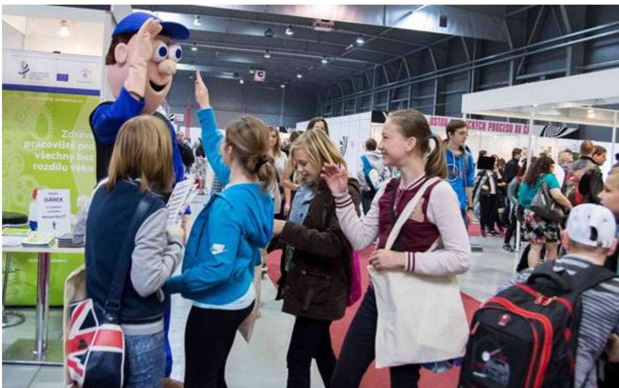
Obr. 1: Na Veletrhu vědy to vřelo, a před naším stánkem také

Příležitostí pro komunikaci s veřejností není nikdy dost. Platí to i pro témata bezpečného chování, prevence úrazů a rizik a bezpečnosti a ochrany zdraví při práci i v běžném životě. Veletrh vědy je vzácnou příležitostí oslovit stejným tématem současně děti, mládeži a dospělé. Týká se totiž bez rozdílu všech. Pod jednou střechou je tak možné popularizovat i výchovně působit na nejširší okruh veřejnosti, tj. popularizovat bezpečnost a ochranu zdraví (vč. bezpečnosti a ochrany zdraví při práci) a výchovně působit na děti a jejich rodiče, prarodiče a pedagogy ve věci bezpečného chování a protiúrazové prevence. Pro pořadatele z VÚBP, v.v.i. byl příjemným překvapením nefalšovaný zápal a chuť návštěvníků stánku dozvědět se o prezentovaném tématu co možná nejvíce. Veletrh vědy je největší akcí svého druhu v České republice. Ačkoliv jde o poměrně mladou akci, zdá se, že by se – alespoň podle dosavadních dojmů a zkušeností VÚBP, v.v.i. - dalo říci, že kdo z široké obce českých vědeckých a výzkumných pracovišť a center, firem, univerzit a dalších zástupců vědy a výzkumu není na Veletrhu vědy viděn, jako by nebyl.