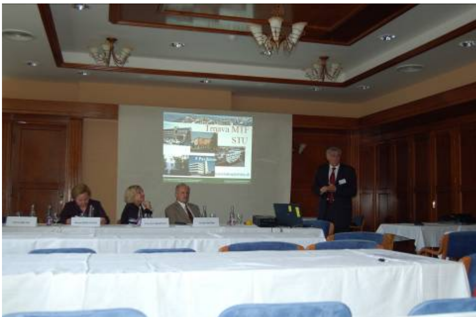
Obr. č. 3: Prof. Balog představuje výzkumné aktivity Slovenské technické univerzity