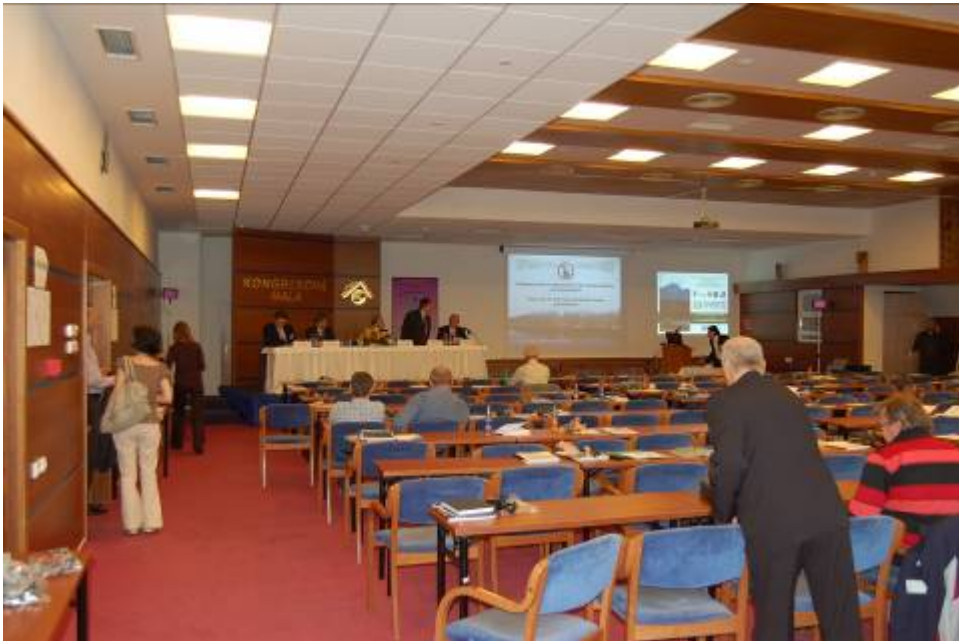
Obr. č. 1: Kongresová hala v hotelu Patria