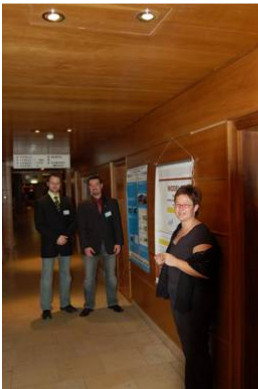
Obr. č. 5: Prezentace posterů k projektu SPREAD ve foyer kongresového sálu