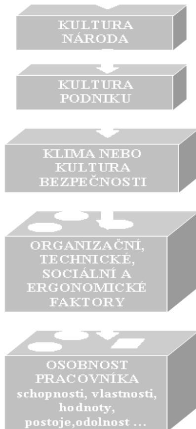
Obr. č. 1: Bariérový model

Nehoda či úraz jsou obvykle následkem celého komplexu příčin. Není proto vhodné označovat za příčinu některý jednoduchý činitel. Mohou to být například příčiny technické, technologické, ergonomické, organizační, osobnostní, kulturní. Může být na vině i sociální klima, manažerské rozhodnutí nebo chyba pracovníka či celé skupiny. Ilustrativní model vzniku nehody či úrazu podává bariérový model: