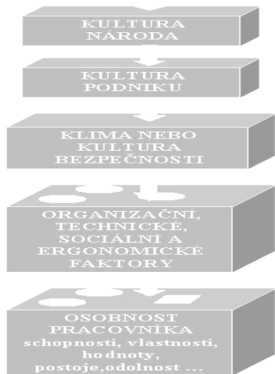
Obr. č. 2: Schéma tří aspektů osobnosti, důležité pro poznávání osobnosti i její výchovu