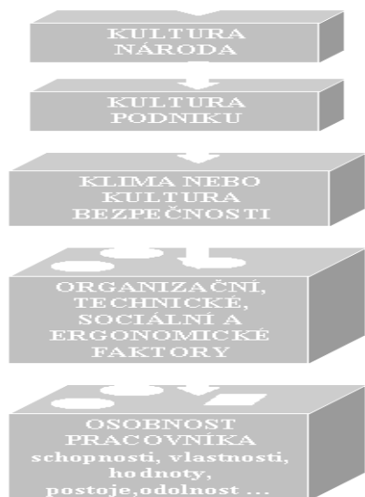
Obr. č. 2: Schéma tří aspektů osobnosti, důležité pro poznávání osobnosti i její výchovu