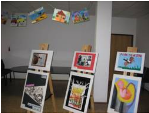
Obr. č. 3 a 4 Dětská výtvarná soutěž k BOZP