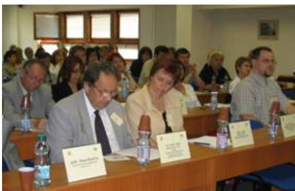
Obr. č. 2 Účastníci konference

Z globálního pohledu lze uvést, že každoročně umírá na naší planetě na následky pracovních úrazů a nemocí z povolání více než 2 miliony lidí. Celková pracovní úrazovost v průběhu jednoho roku je odhadována na 270 milionů případů; kolem 160 milionů lidí onemocní nemocí z povolání. Ekonomické ztráty z titulu uvedených nežádoucích událostí jsou celosvětově odhadovány na 4 % HDP. V České republice celková pracovní úrazovost v průběhu posledních let stane a počet prostonaných dnů na jeden pracovní úraz dokonce narůstá. Ekonomické ztráty pro pracovní úrazy a nemoci z povolání dosahují 29,4 miliardy Kč a každoročně se zvyšují. Závažnou skutečností je vznik nových rizik – např. stresu, který podle provedených studií stojí v pozadí 50 % - 60 % všech zameškaných pracovních