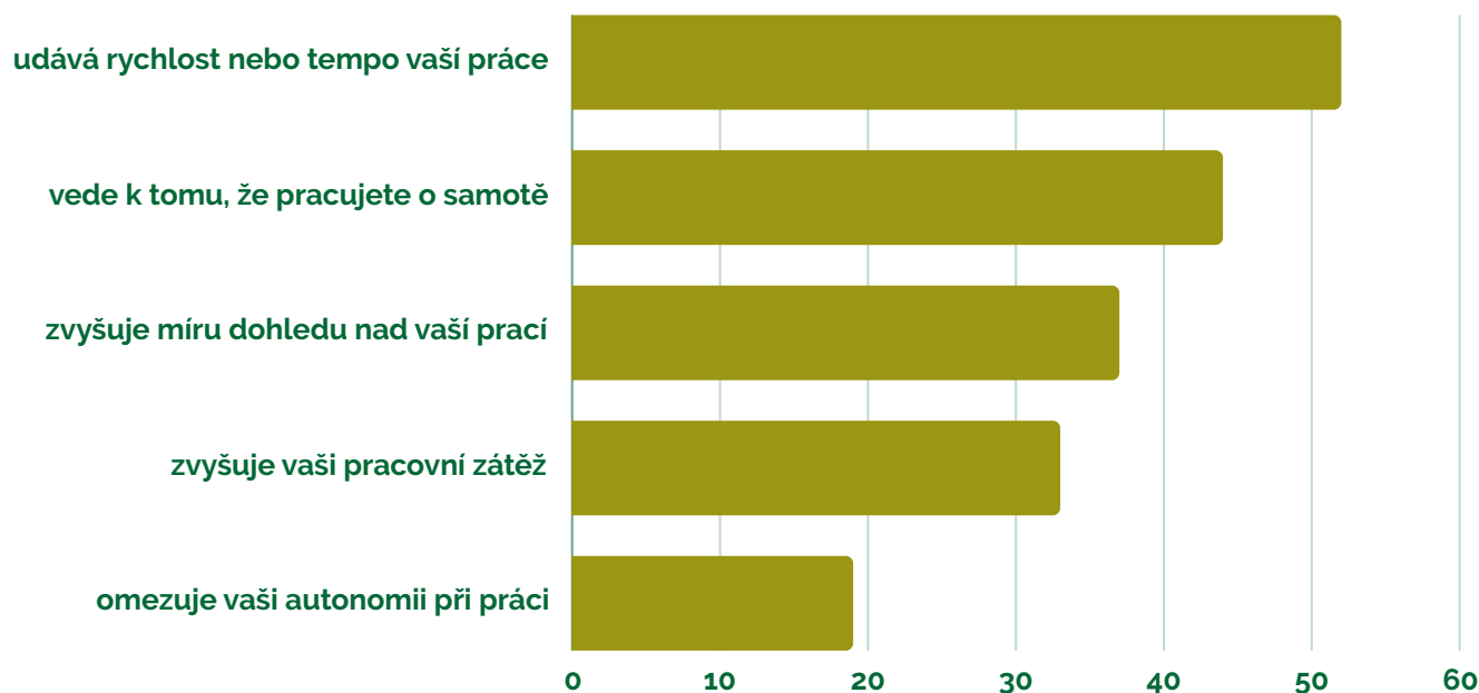
Graf 1 - Výsledky šetření Puls BOZP