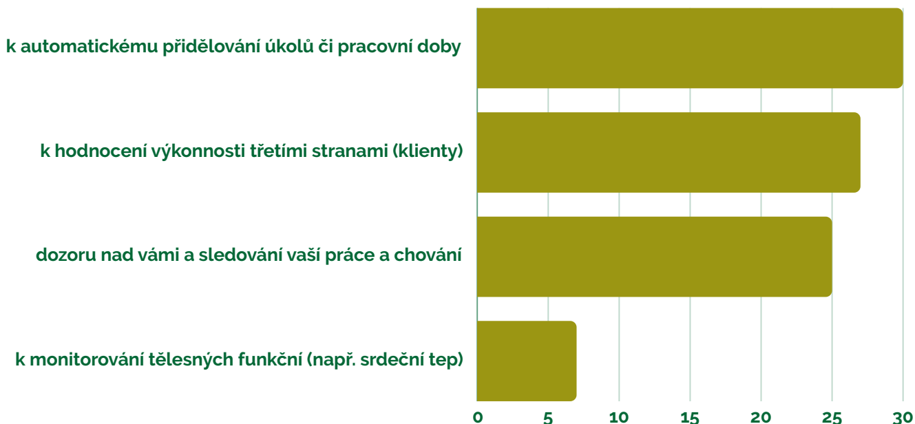
Graf 2 - Výsledky šetření Puls BOZP

Pokud je vám známo, používá organizace, ve které pracujete, digitální zařízení, jako jsou tablety, chytré telefony, počítače, notebooky, aplikace nebo senzory k...? (% odpověď „ano“, EU 27, počet respondentů = 25 683)